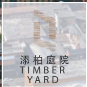
添柏庭院 TIMBER YARD